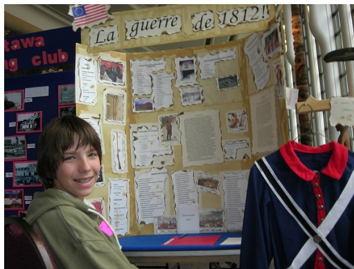
Quelques-uns des projets présentés par des élèves francophones lors de l'exposition publique