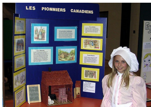
Une occasion sans pareille de reconnaître les réalisations de vos élèves